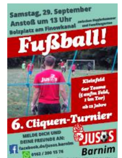
Plakat zum Fußballturnier