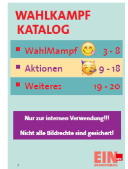
Inhaltsverzeichnis des Wahlkampfkatloges